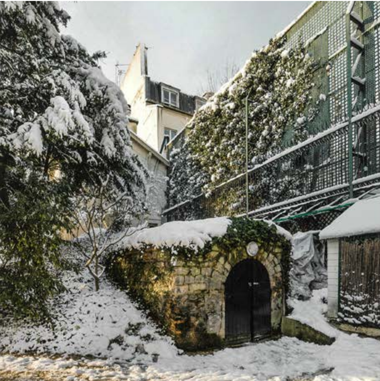
L'Hôtel de Matignon, Du XVIIIe siècle à nos jours, La Documentation Française, 2018, Paris

Restauration de la glacière et assainissement de l'édifice voisin